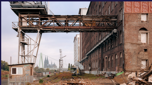
Blick auf die zukünftige Hafenpromenade

Erleben Sie die zukünftige Nutzung der Holzhalle als urbanen Ort für Sport, Spiel & Gastronomie. Gemeinsam mit lokalen Vereinen können Sie die geplanten Sportangebote (u.a. Skaten & Basketball) ausprobieren und uns Feedback hierzu geben. Junge Besucher*innen (bis 10 Jahre) können zudem bei einem Workshop an der Spielplatzgestaltung im Deutzer Hafen mitwirken.